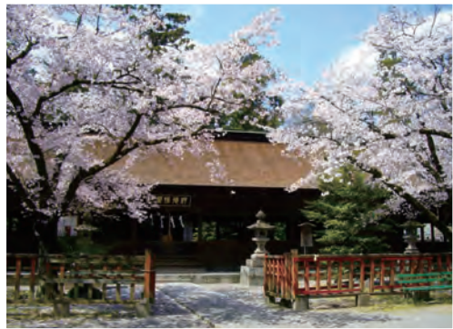
大井保窪八幡神社 現存する最古の木造鳥居を有し、武田信玄や信玄の父の信虎に篤く信仰された神社です。