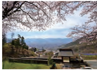
永昌院 武田信玄の曾祖父である信昌の菩提寺であり、信玄の子勝頼が戦陣で使用したと伝わる銅鐘があります。