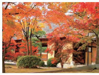
八田家書院 武田家家臣の屋敷を徳川家康より拝領した用材にて再建築した茅葺き入母屋造りの建物です。