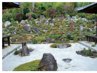
松本山 大蔵経寺 武田氏戦勝祈願のお寺で枯山水庭園や国指定文化財の絹本着色涅槃図(レプリカ)などが拝観できます。